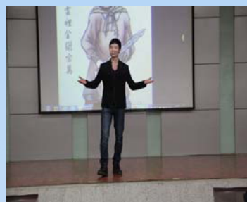
参赛选手与大家一起分享读书心得