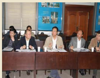
校文献信息工作委员会委员发表意见和建议