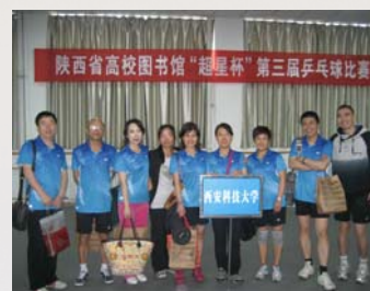
我馆派代表参加陕西省高校图书馆“超星杯”第三届乒乓球比赛