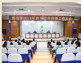
图书馆2014年治安综合治理工作会议现场