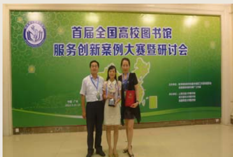
我馆派代表参加首届全国高校图书馆服务创新案例大赛暨研讨会