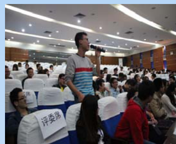
现场观众热烈互动