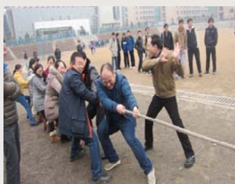
我馆组织职工拔河比赛