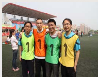
我馆职工参加校运动会4×100米接力