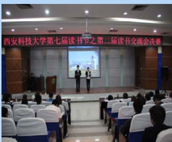
“书话人生” 第二届读书交流会现场