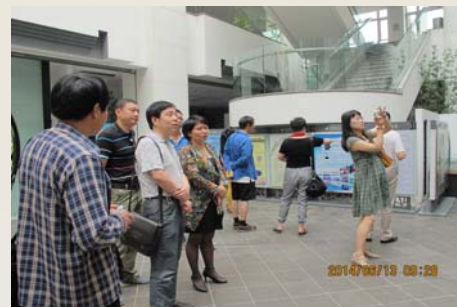
我馆派代表赴苏州图书馆参观交流