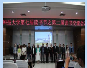
应邀嘉宾与参赛选手合影