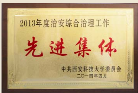
我馆荣获西安科技大学“2013年度治安综合治理先进集体”荣誉称号