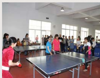
我馆组织职工乒乓球比赛