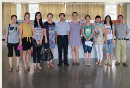
西安工程大学图书馆同仁来我馆参观交流