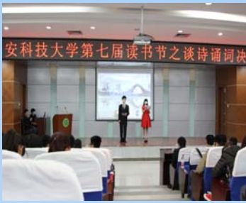
“谈诗诵词” 古典诗词竞答决赛现场