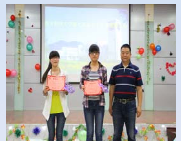
颁奖嘉宾与获奖选手合影