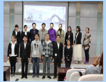
应邀嘉宾与参赛选手合影