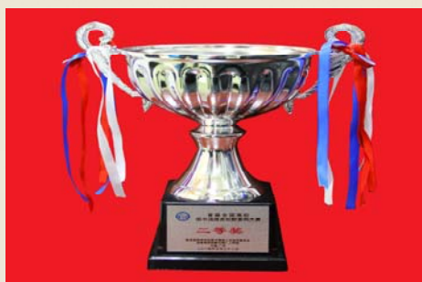
我馆荣获首届全国高校图书馆服务创新案例大赛二等奖