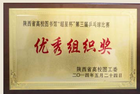
我馆荣获陕西省高校图书馆“超星杯”第三届乒乓球比赛优秀组织奖