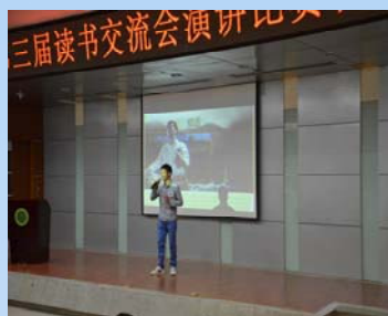
参赛选手与大家分享读书心得