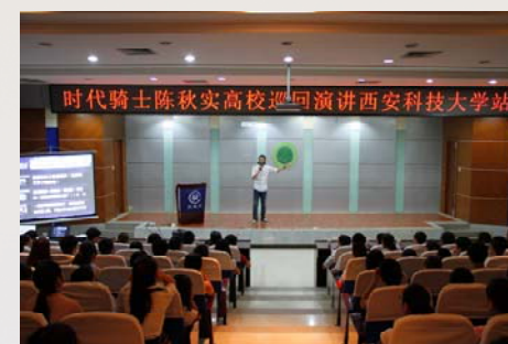
图书馆邀请时代骑士陈秋实来我校演讲