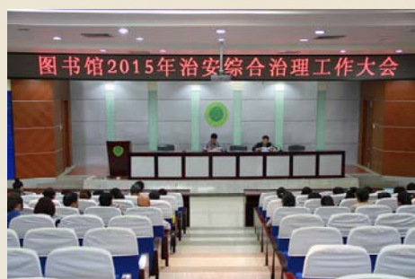
图书馆 2015 年治安综合治理工作大会