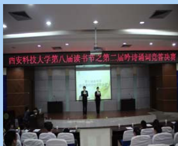
古典诗词竞答决赛现场