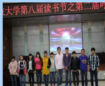
参赛选手与工作人员合影