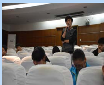
现场观众热烈互动