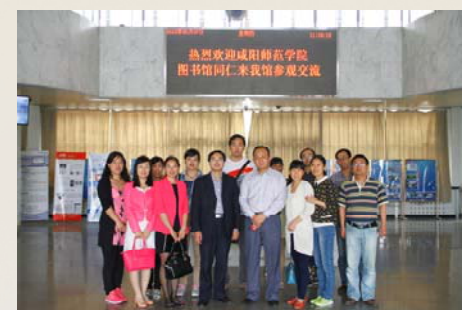
咸阳师范学院图书馆同仁来我馆参观交流