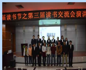
应邀嘉宾与参赛选手合影