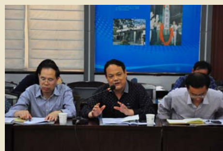
校文献信息资源建设委员会委员 发表意见和建议