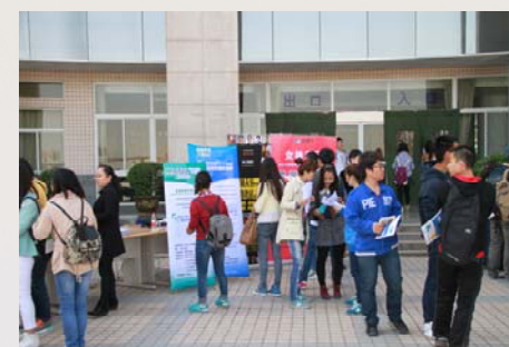
图书馆数据库宣传工作