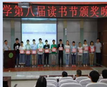
颁奖嘉宾与获奖选手合影