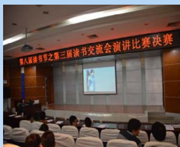
第三届读书交流会现场