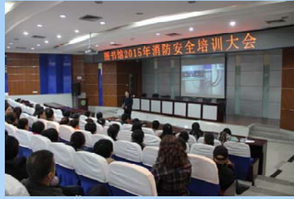
图书馆召开冬季消防安全教育培训大会