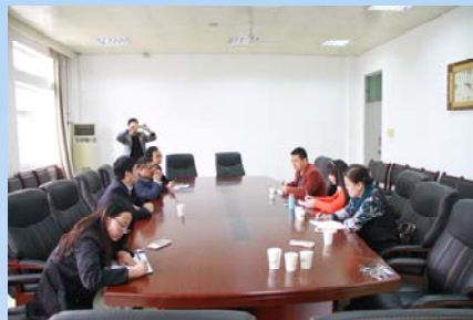
延安大学图书馆副馆长一行来我校图书馆参观交流