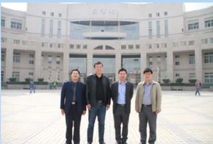
东华理工大学副校长及图书馆馆长来我校图书馆参观交流