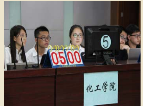
选手争分夺秒检索答案