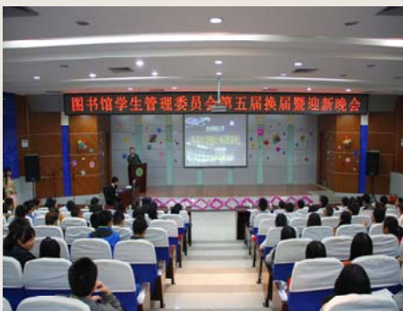
图管会换届暨迎新晚会现场