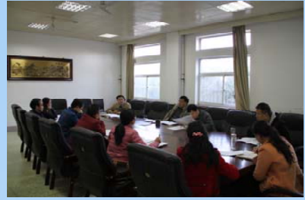
图书馆召开十三五规划编制工作会议