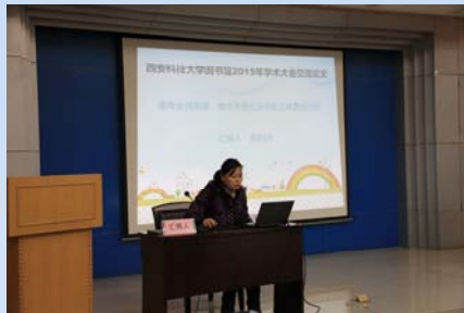
职工进行学术交流