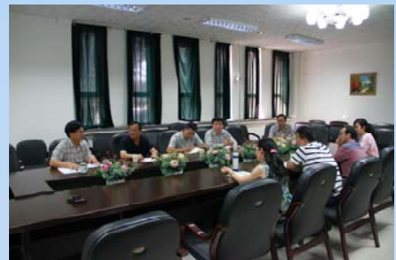
榆林学院图书馆馆长来我校洽谈对口支援工作