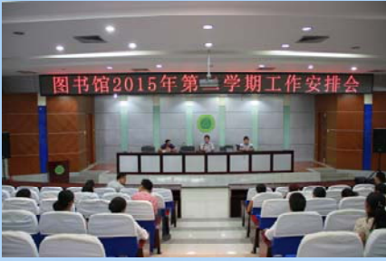
图书馆新学期工作安排的会