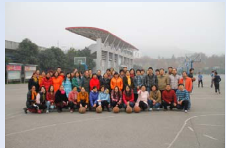
图书馆参加直属单位组织的游艺活动