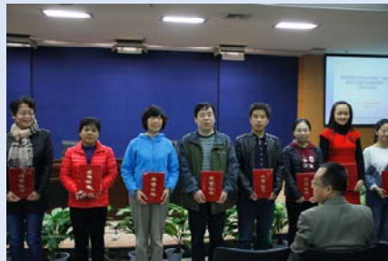
图书馆被陕西省图书馆学会授予2014年度阅读推广工作先进单位