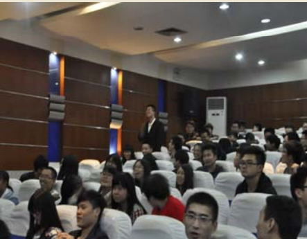
现场观众积极参与答题