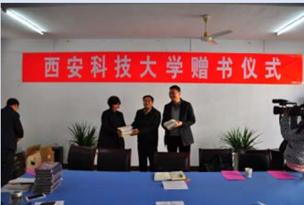
图书馆与佛坪县图书馆结对帮扶