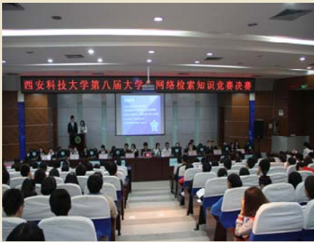
第八届大学生网络检索知识竞赛决赛现场