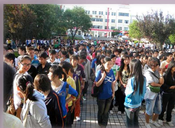
新生排队参观图书馆