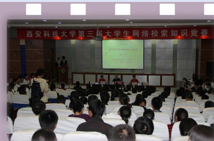
网络检索大赛比赛现场

本次培训活动共完成讲座13场。同学们对图书馆的资源与服务有了一个全面系统的了解，为他们有效利用图书馆奠定了良好的基础，图书馆的老师们度过了一个有意义的节日。