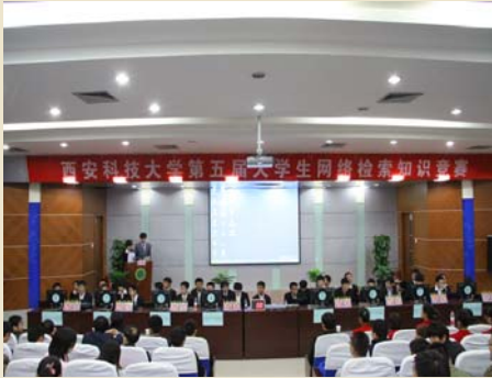
第五届大学生网络检索知识竞赛决赛现场