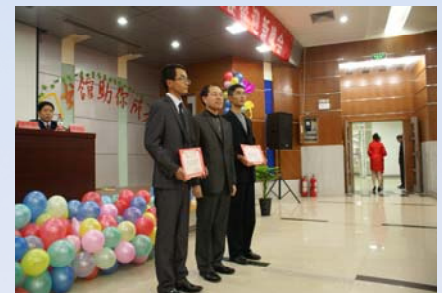
王馆长为新一届图管会成员颁发聘书