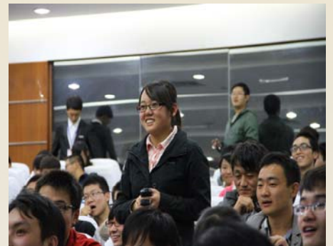
现场观众积极参与答题