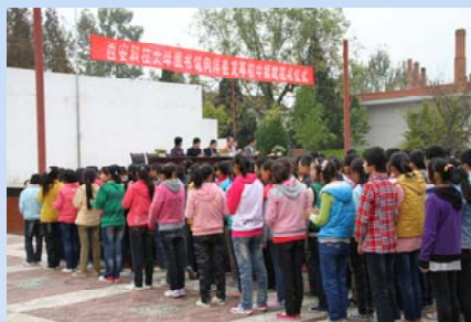
党员代表赴汉中洋县龙亭中学捐赠图书