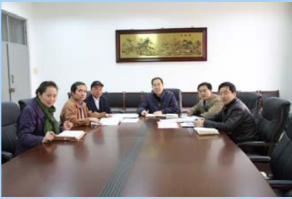
图书馆学术委员会开展业务研讨