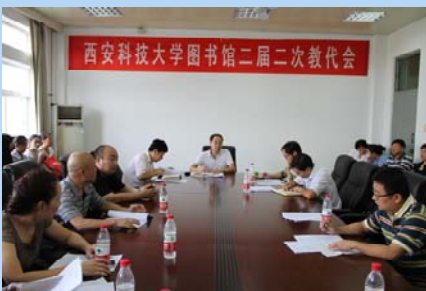
王馆长主持二届二次教代会