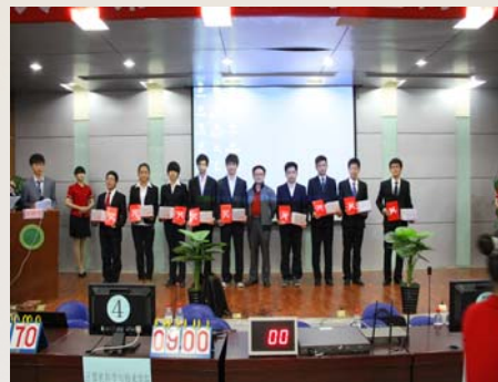
领导与获奖学生合影