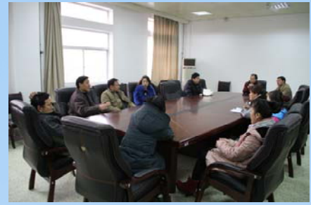
图书馆开展部室调研活动