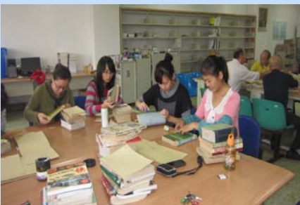
党员修补破损图书