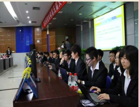
选手争分夺秒检索答案