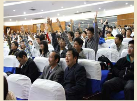
现场观众热烈互动