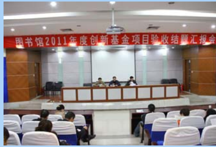
图书馆创新基金项目验收结题汇报会