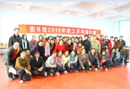
图书馆 2012 年职工乒乓球比赛