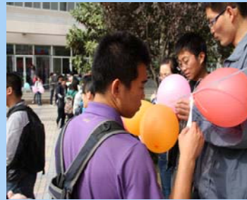
同学们积极参与主题猜谜活动