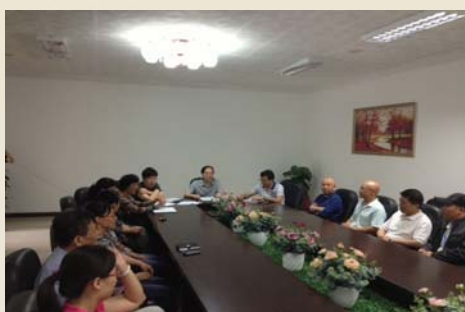
图书馆组织全体党员进行政治理论学习