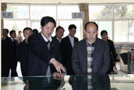
省委教育工委常务副书记董小龙来我馆参观