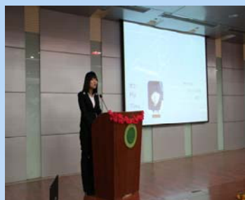
参赛选手与大家一起分享读书 心得