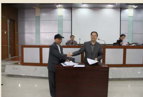
图书馆2013年综合治理目标责任书签订现场