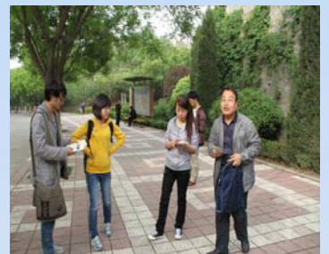
向我校教职工发放图书馆宣传 彩页