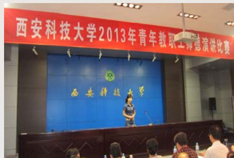
我馆派代表参加西安科技大学2013年青年教职工师德演讲比赛