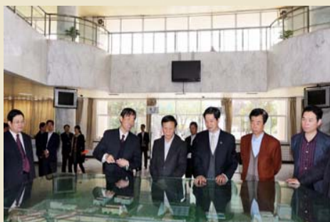
省委副书记孙清云来我馆检查指导党建工作