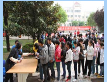
同学们排队领取奖品