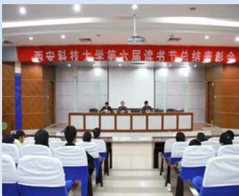
读书节表彰大会现场