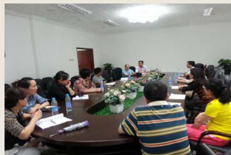
北亚利桑那大学图书馆与我馆交流座谈会