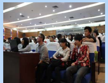
会场上大家认真聆听