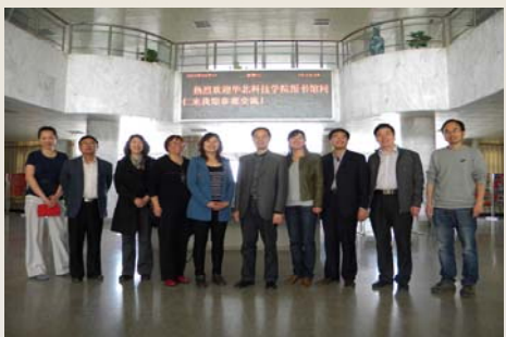
华北科技学院图书馆同仁来我馆参观交流