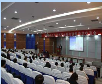
大学生讲堂读书交流会现场