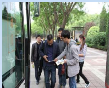
向我校教职工发放图书馆宣传 彩页