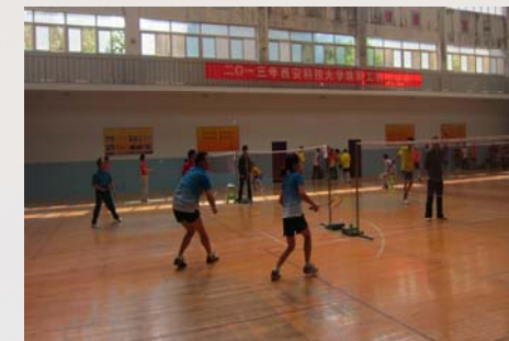
我馆派代表参加2013年校工会组织的羽毛球比赛