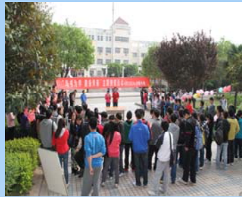
主题猜谜活动现场