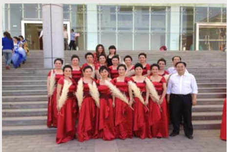
我馆派代表参加陕西省高校女工委组织的“唱响时代旋律 展现巾帼风采”合唱比赛