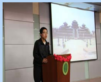
参赛选手与大家一起分享读书 心得