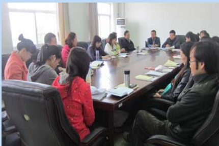
第二党支部开展党的群众路线教育实践活动集中学习