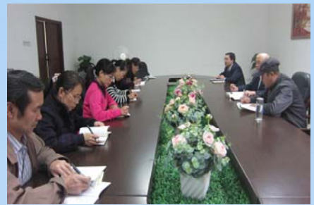
第一党支部开展党的群众路线教育实践活动集中学习