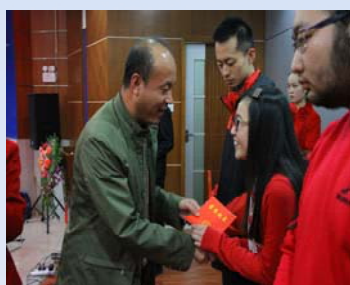
领导为获奖选手颁奖