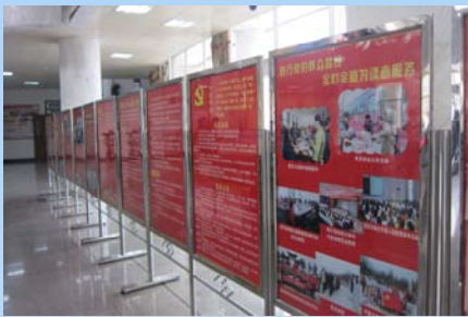
党的群众路线教育实践活动展板