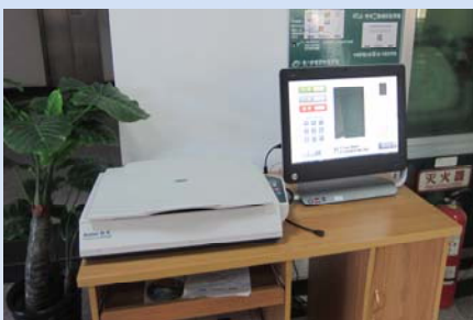
引进自助扫描设备