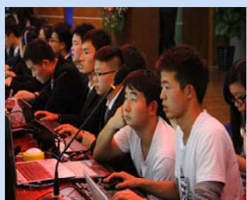
选手们快速检索答案