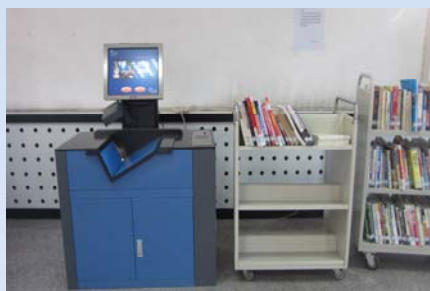
引进自助借还图书设备