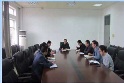
馆领导及部主任开展党的群众路线教育实践活动集中学习