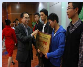
领导为获奖团体颁奖