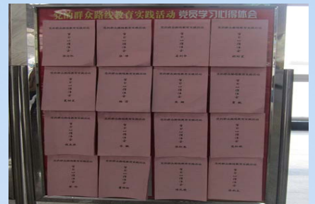
党员群众路线教育实践活动学习心得体会交流展板