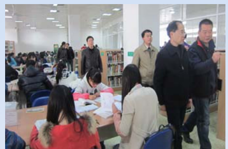
馆领导解决占座问题办公现场