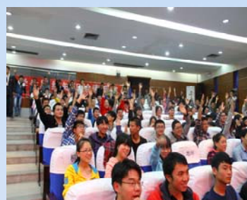
现场观众积极互动