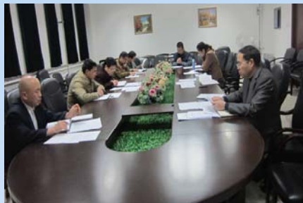
馆领导及部主任召开民主生活会