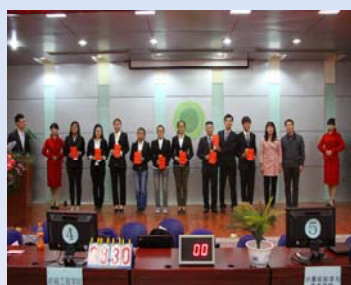
领导与获奖选手合影