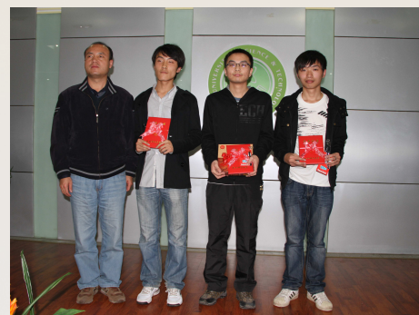
领导与获奖学生合影