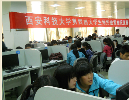
网络检索竞赛预赛现场