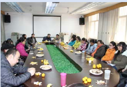
2011 年图书馆青年职工座谈会