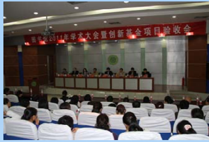
2011 年图书馆学术大会召开