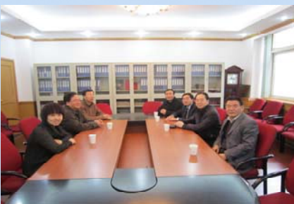
馆领导与西安建筑科技大学图书馆交流