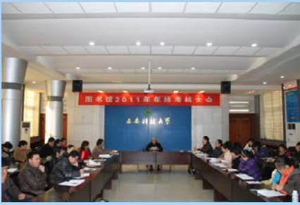
2011 年图书馆职工年终考核大会