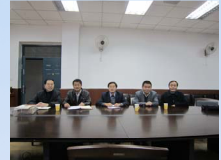
馆领导与西安理工大学图书馆进行交流