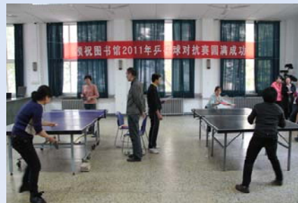
2011 年图书馆乒乓球对抗赛