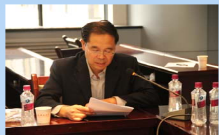
王馆长汇报文献资源建设情况