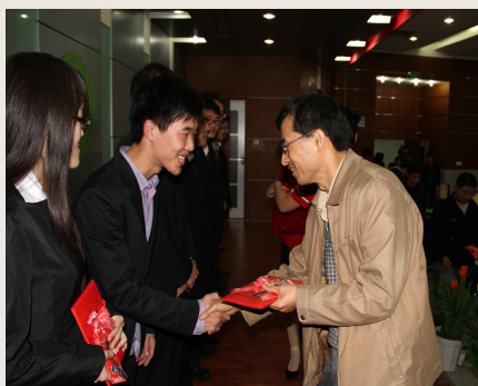
领导为获奖学生颁奖