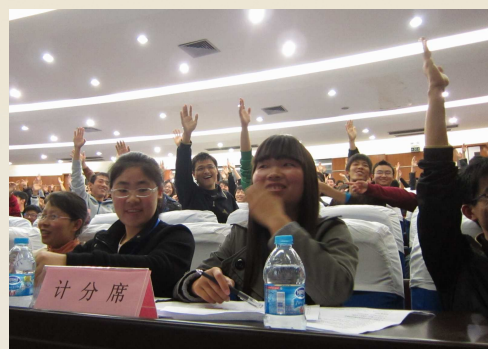
现场观众热烈互动