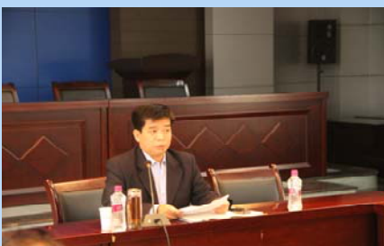
杨校长主持校文献资源建设会议