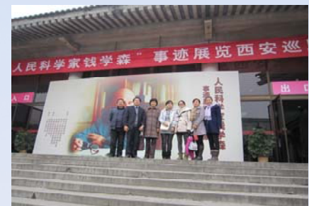
部分党员参观钱学森事迹展览