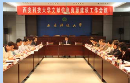
与会人员认真听取会议精神