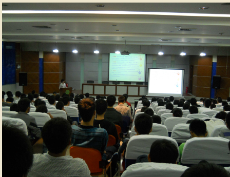
为参赛选手做检索技巧培训