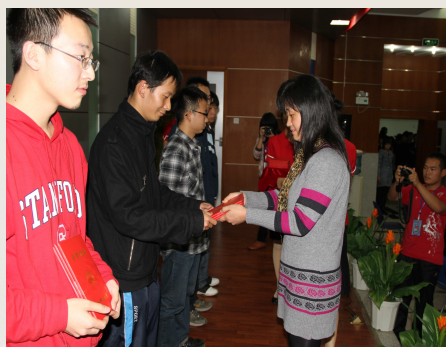
领导为获奖学生颁奖