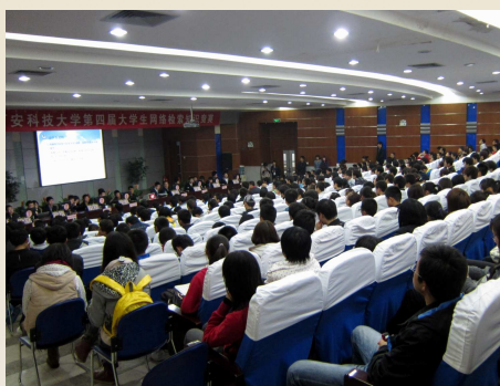
第四届大学生网络检索知识竞赛决赛现场