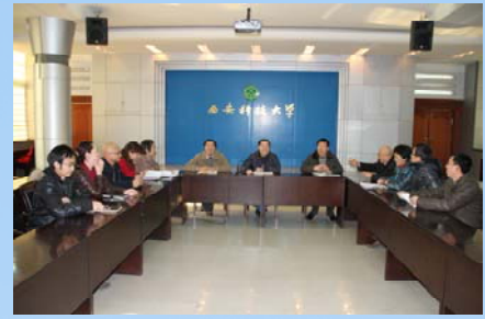
图书馆馆务委员会开展业务研讨