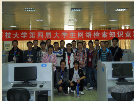
校学生会积极协助竞赛举办