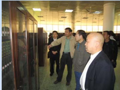
部室骨干与西安工程大学图书馆交流